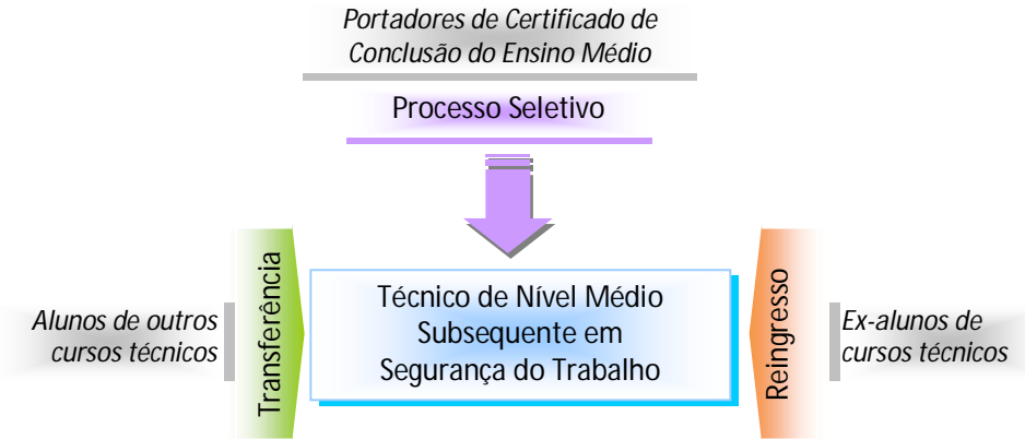
Figura 1 – Requisitos e formas de acesso ao curso.